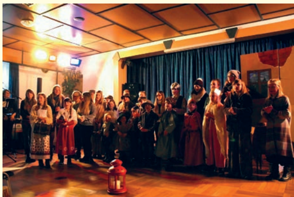
Kinderkrippenspiel „Vater Martin“ in Schmalzgrube