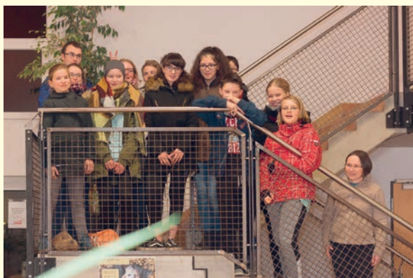
Jöhstädter Krippenspieler beim „Danke-Schön“ – Ausflug in die Kletterhalle Pockau