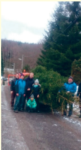
Beim Herbeiholen des Weihnachtsbaumes und Reparieren der Leuchter der Jöhstädter Kirche