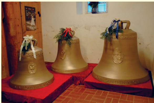
Die neuen Grumbacher Glocken sind da!