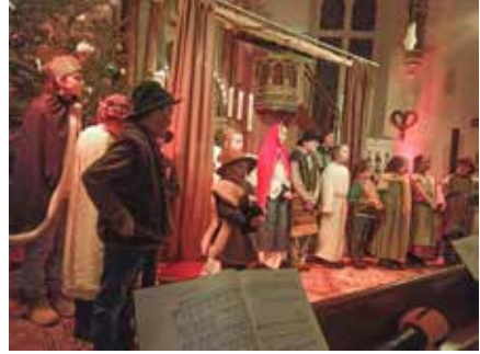
Kinderkrippenspiel in Grumbach