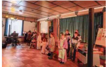
Kinderkrippenspiel in Schmalzgrube