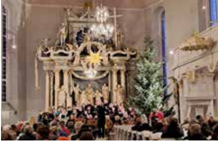
Adventsmusik in Jöhstadt