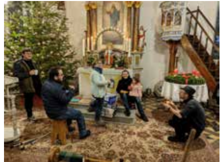
Heiligabend – Zwischen den Krippenspielen in Schmalzgrube und Grumbach